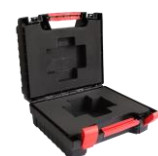
Valise plastique Plastic case