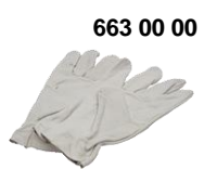
Gants cuir Leather gloves

ZWIEBEL SAS - SAINT JEAN SAVERNE - BP 50002 - F-67701 SAVERNE CEDEX